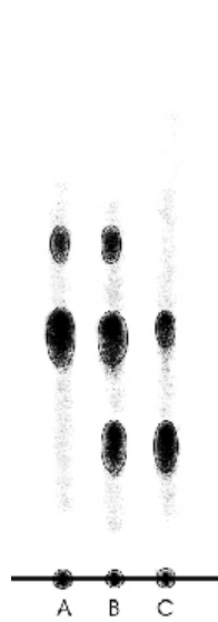
Рис. 2. Результат ТСХ анализа экстрактов свежей кожицы винограда: А – Каберне Совиньон; В – Молдова; С – Виллар Нуар

где C_1 – массовая концентрация пигментов в сусле и вине (мг/дм 3 ), B_{ДГ} – балл, присвоенный пятну суммы антоциановых дигликозидов ( R_f=0.25 ); B_{МГ} – балл, присвоенный пятну моногликозидов ( R_f=0.45 ) и B_{АГ} – балл, присвоенный пятну 6'-ацелированных моногликозидов ( R_f=0.60 ), K_3 – коэффициент пересчета на мальвидин-3,5-дигликозид, который соответствует отношению удельных оптических плотностей растворов мальвидин-3,5-дигликозида и мальвидин-3-моногликозида и равен 1.33.